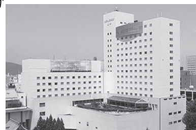
ホテルフジタ福井3F ザ・グランユアーズフクイ 〒910-0005 福井県福井市大手3-12-20